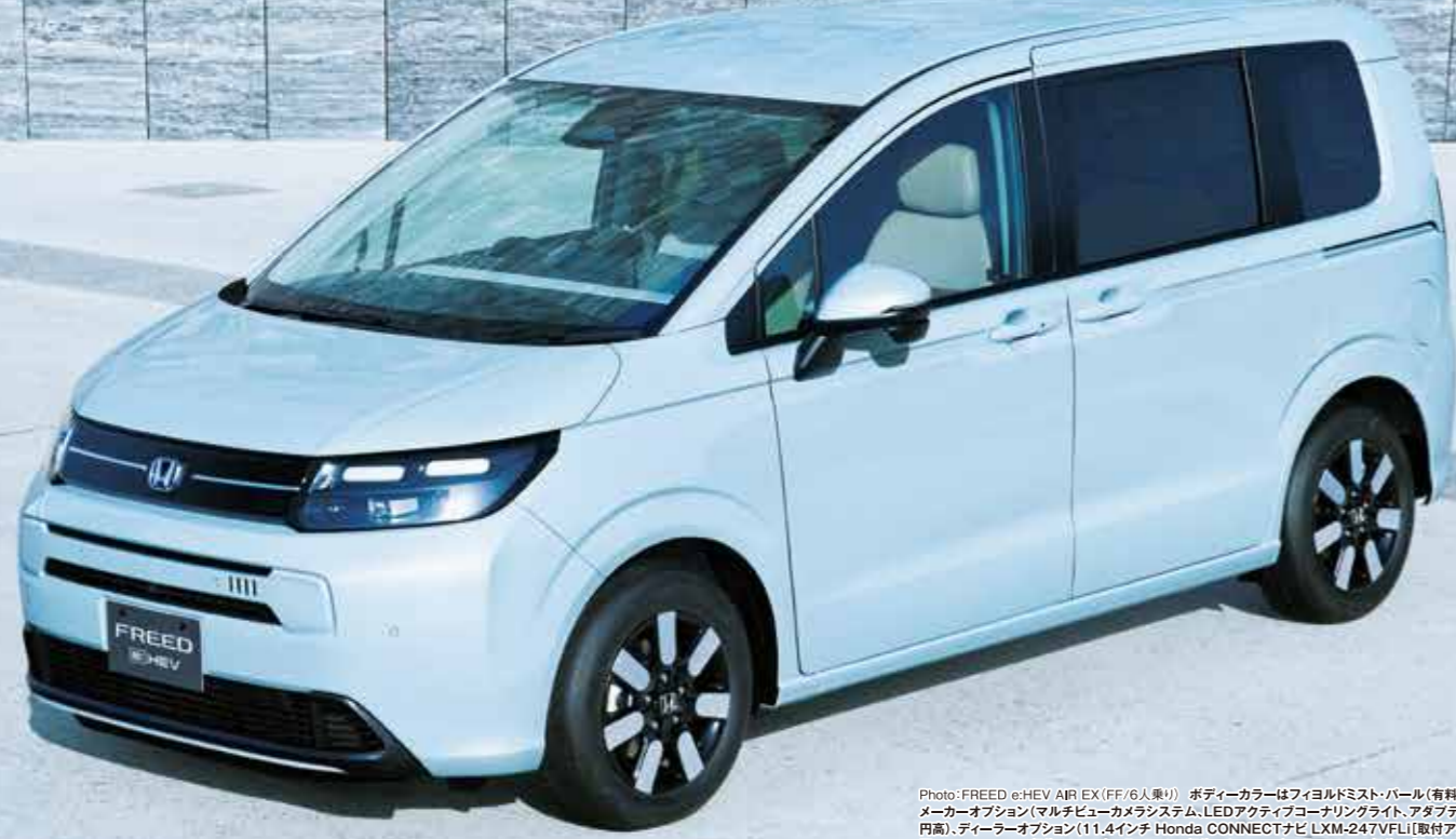
Photo: FREED e:HEV AIR EX (FF/6人乗り) ボデーカラーはフィヨルドミストパール(有料色:38,500円高) インテリアカラーはグレース。メーカーオプション(マルチビューカメラシステム、LEDアクティブコーナリングライト、アダプティブドライビングビーム、後述出庫サポート:119,900円高)、ディーラーオプション(11.4インチ Honda CONNECTナビ LXM-247VFLI [取付アタッチメント含む] 320,100円 [取付工賃別途]) 装着車 ■LXM-247VFLIの価格は2024年7月4日からの価格です。2024年7月3日までの価格は [取付アタッチメント含む] 302,500円 [取付工賃別途] です。