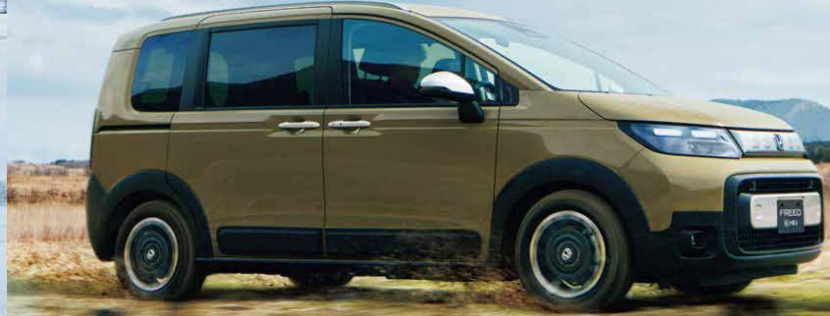
Photo: FREED e:HEV CROSSTAR (FF/5人乗り) ボデーカラーはデザートベージュパール(有料色:38,500円高) ディーラーオプション(11.4インチ Honda CONNECTナビ LXM-247VFLI [取付アタッチメント含む] 320,100円 [取付工賃別途]) ボデーカラー専用ホイール 33,000円 [取付工賃別途] 装着車 ■LXM-247VFLIの価格は2024年7月4日からの価格です。2024年7月3日までの価格は [取付アタッチメント含む] 302,500円 [取付工賃別途] です。